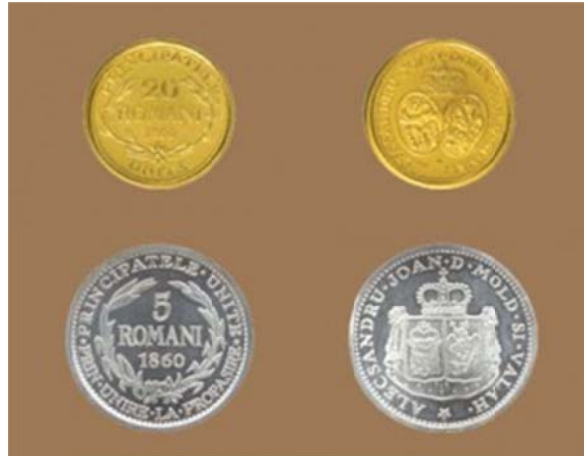
Medalii de aur și argint emise de Banca Națională a României, care reproduc monedele pe care Alexandru Ioan Cuza intenționa să le emită în anul 1860

Dar, de câțva timp, mă simt oprit, Sire, la mijlocul sarcinii mele, și rog Majestatea Voastră imperială a-mi permite să-i expun sincer părerea mea despre dificultățile ce le întâmpin. Fost-am prea temerar? M-am încrezut prea mult în puterile țării mele și în valoarea instrumentelor de care dispun? Sunt eu însumi la nivelul rolului înalt ce mi l-a atribuit Providența? Nu știu! Dar mi se pare că simpatiile câștigate până atunci s-au răcit. Vagi indicii îmi dezvăluiau mai dinainte această situație nouă, când «Le Moniteur» a publicat, de două ori în cursul lunii septembrie, rânduri descurajante sub care aș fi putut vedea, în ordinea de idei ce mă călăuzește, un fel de avertisment cu totul părintesc al Majestății Voastre imperiale, dar care trebuiau să fie și care au fost primite cu o satisfacție «prea» puțin deghizată de către guvernele vecine și cu dureroasă emoție de către țară. Ce intenții au inspirat aceste rânduri? Nu-mi este permis să mă opresc o singură clipă asupra combinațiilor recomandate de presa din Austria, asupra acelor calcule care fac din Principatele Unite obiectul unei compensații teritoriale. Niciodată nu voi crede, niciodată, un singur român nu va vrea să creadă că existența naționalității române independente ar putea fi sacrificată cât timp vocea împăratului Napoleon va fi preponderentă în lume.