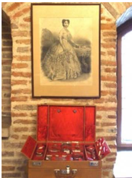
Trusa de voiaj a doamnei Elena Cuza

Orice minte nepărtinitoare va recunoaște că de șase ani România a văzut realizându-se transformări mari și fericite.