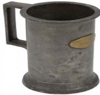
Ocaua lui Cuza

prosperității României și, mai ales, răspândirea la frontierele lor a ideilor civilizatoare ale Occidentului.