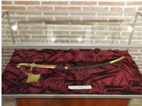
Sabia de învestitură a domnitorului Alexandru Ioan Cuza

Încrederea fără rezervă ce arăt Majestății Voastre imperiale va atrage, îndrăznesc a spera, pe a sa. Numai împăratului Napoleon trebuie și vreau să-i cer un sfat. Răspunsul vostru, Sire, va fi, nu mă îndoiesc, o dovadă nouă a grijii voastre statornice pentru țara mea și cu o adâncă încredere vin, în această împrejurare solemnă, să cer puternica protecție a Majestății Voastre imperiale pentru poporul român“.