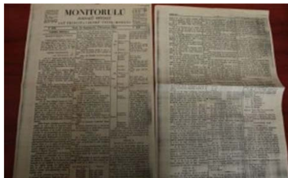
Legea metrologiei in Monitorul Oficial

Am promulgat coduri calchiate pe Codul Napoleon, care stabilesc efectiv egalitatea tuturor în fața legii și drepturile egale ale tuturor în familie, care impun căsătoria civilă și înfrânează divorțul. Am dat străinilor dreptul de proprietate. Administrarea justiției, care lasă mult de dorit, se îmbunătățește sub influența Curții de Casație. Reorganizarea finanțelor noastre, angajate în încercări pe care le consider premature, nu a răspuns așteptărilor mele: Curtea de conturi și Casa de consemnațiuni vor asigura succesul unor reforme devenite foarte urgente. Am făcut instrucțiunea primară obligatorie și gratuită, am instituit sistemul zecimal, am creat spitale, școli pe care Majestatea Voastră a binevoit a le onora cu încurajările sale. Am mărit rețeaua căilor noastre de comunicație; am construit poduri, care lipseau aproape peste tot; o linie de patru sute de kilometri căi ferate este în construcție, o alta va fi începută la primăvară. Sunt pe punctul de a concesiunea dreptul «de a ființa» o bancă națională. În sfârșit, am vrut ca forțele noastre «armate» naționale să fie temeinic organizate, capabile de a menține în orice ocazie liniștea internă, capabile de a-și ocupa cu cinste locul lor, dacă eventualități, oricând posibile, ar amenința un Imperiu pe care l-au consolidat armele Franței și de soarta căruia sunt legate strâns destinele noastre.