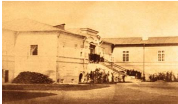
Palatul Cotroceni în timpul domniei lui Alexandru Ioan Cuza

Timp de aproape un secol, Sire, Principatele au constituit prada străinilor; când un loc de trecere, când un câmp de bătălie pentru armatele Austriei, Rusiei sau Turciei; aproape totdeauna ocupate militar și devenind de atunci un centru de intrigi a căror fir îl țineau anumite Puteri ostile totdeauna intereselor și un târg obișnuit unde se făcea trafic cu bunurile jefuite de la noi, pentru a îmbogăți Fanarul sau pentru a combate influența occidentală în Orient. Cu veniturile noastre și pe pământul nostru Rusia, stăpână pe atunci a Principatelor, forma în 1854 acea legiune greco-slavă pe care soldații Majestății Voastre imperiale au întâlnit-o în tranșeele Sevastopolului. Este nevoie să spun cât au apăsât asupra țării aceste încercări teribile, mai curând din punct de vedere moral decât din punct de vedere material? Astăzi, Sire, mulțumită sprijinului vostru generos, românii au o existență politică; ei au conștiința drepturilor lor și a datoriilor lor; puțini ar fi printre ei cei care nu s-ar rușina «la gândul» unei protecții străine, care acum câțiva ani încă era căutată ca o onoare. Într-un cuvânt, Sire, poporul român își trăiește de acum înainte propria sa viață, el este român și numai român.